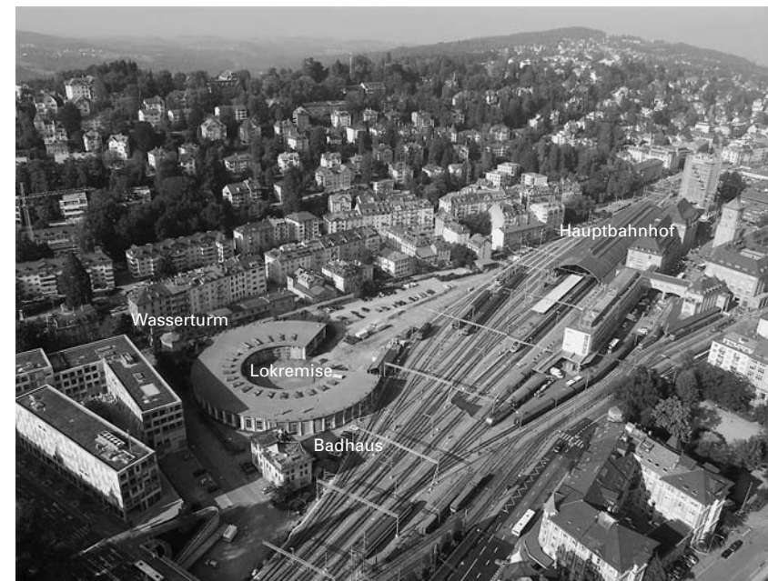
Ansicht von der Rosenbergstrasse (Fotomontage)

gung gestellt werden. Der Kanton erhält damit ein innovatives Kulturzentrum mit überregionaler Ausstrahlung. Tanz, Theater, Film und Kunst treffen in der Lokremise unter einem Dach zusammen und erhalten Raum für Experimentelles. Neuartige Verbindungen zwischen verschiedenen Kunstsparten und Institutionen können erprobt werden. Ergänzt durch einen Gastronomiebetrieb werden einzigartige Angebote für ein breites Publikum entstehen. Die Räume werden zudem für die unterschiedlichsten Anlässe aus den Bereichen Kultur, Bildung, Politik und Wirtschaft genutzt werden können. Als Ort, der für Experimente und dynamischen Wandel steht, hat die Lokremise das Potenzial, sich zu einem entscheidenden Imageträger St.Gallens zu entwickeln und das Profil der Kultur-, Bildungs- und Tourismusregion massgeblich zu stärken. Sie trägt damit dazu bei, dass sich der Kanton im Standortwettbewerb, der auch im Kulturbereich stattfindet, gut positionieren kann.